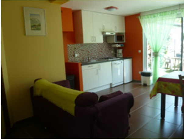
"Gîte le Nid" 6, rue du Hôo 65400 ARRENS-MARSOUS